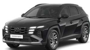
Abyss Black Pearl Perleťová Cena: 0 Kč