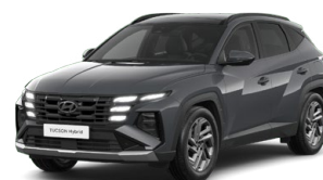
Ecotronic Gray Pearl Perleťová Cena: 0 Kč