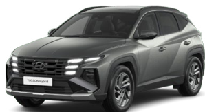
Pine Green Matt Matná Cena: 15 000 Kč